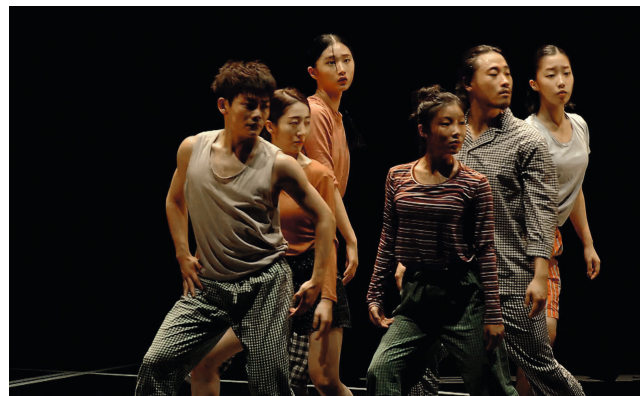
第 45 届 K-Arts 舞蹈团定期演出