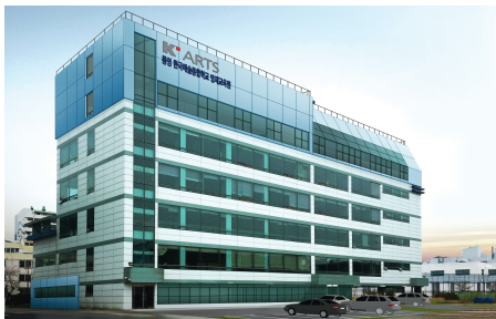
韩国艺术英才教育院统营校区