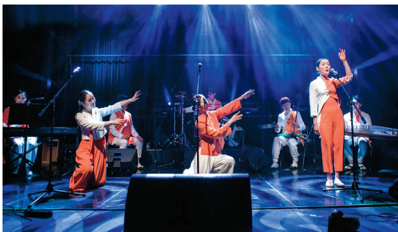
K-Arts Borderless Online Festival 2020