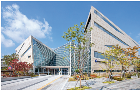
韩国艺术英才教育院世宗校区