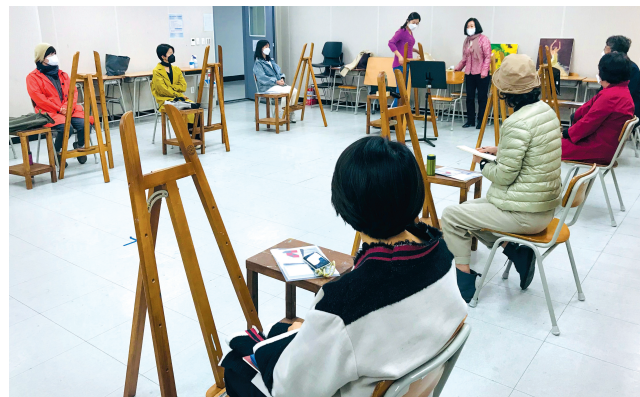
K-Arts 文化教育中心继续教育项目