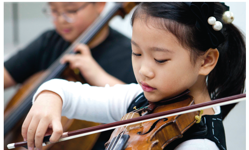
韩国艺术英才教育院在校生