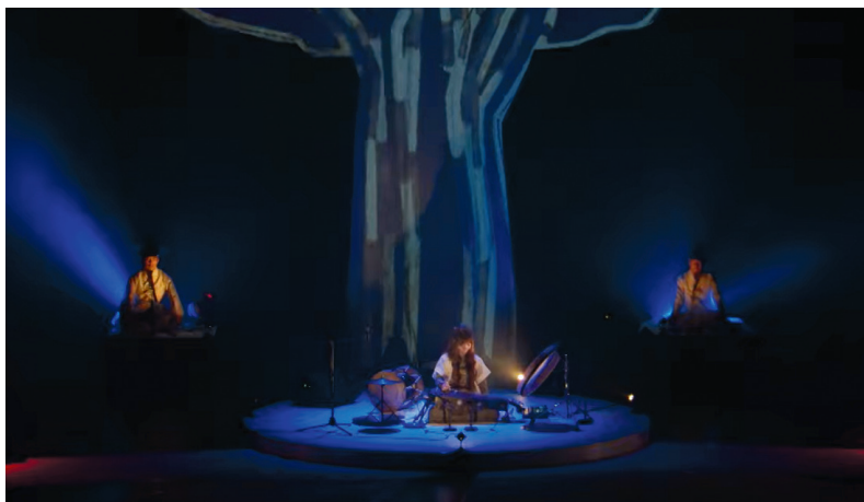
《Two Hands》Arts Electronica Festival 2020