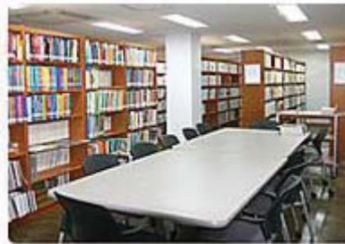
▲ 교과서정보관 열람실