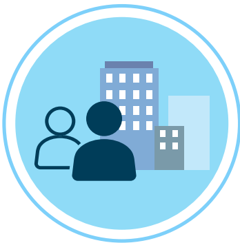
개인 및 단체 저작권자